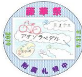
1-B 岡本 美月さんのレイアウトが採用されました