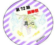
3-C 稲毛 萌乃さんのレイアウトが採用されました