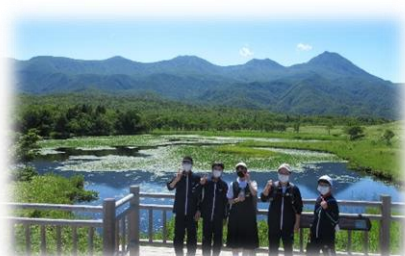
【修学旅行・知床国立公園】