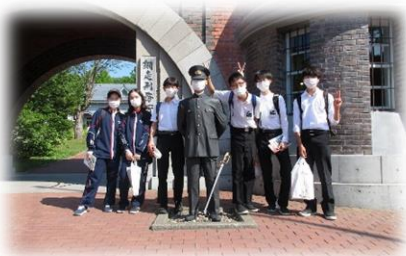
【修学旅行・網走監獄】