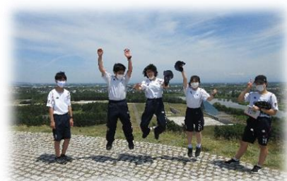
【校外学習・モエレ沼公園】