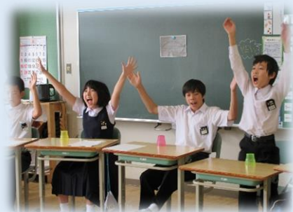
◀▶ こちらの二つは教室での練習の様子

▼これは、ステージパフォーマンスの練習の様子。教室、中学校体育館と場所を移して練習を続けています。やがて、当日、中学校体育館に現れる彼らの姿をお見逃しなく。